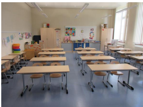
Klassenzimmer in Doppelnutzung