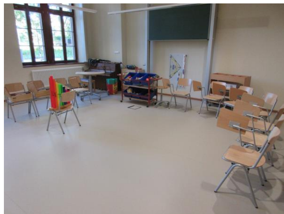
Musik und Bewegung